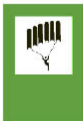
3.4. Площадка за пара- и дельтапланеристи

Забележка. Цветове на знаците - знак 3.4 - зелен фон, черно изображение върху бял правоъгълник, и съответно знак 3.5 - лилаво-син фон, бяло изображение.