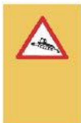
1.1. Машинна обработка на пътища