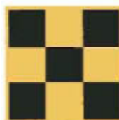
2.2. Флагчета за обозначаване на прегради и опасности