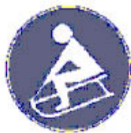
3.5. Маркировка на участъци с шейни

Забележка. Цветове на знаците - знак 3.4 - зелен фон, черно изображение върху бял правоъгълник, и съответно знак 3.5 - лилаво-син фон, бяло изображение.