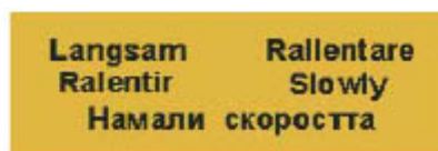
2.4. Лента за зона с ограничена скорост