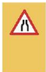
1.3. Стеснен участък