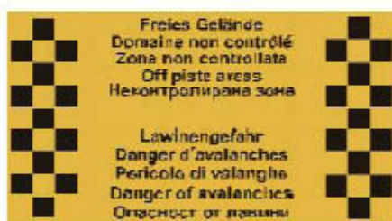
2.1. Опасност от лавини в открити участъци