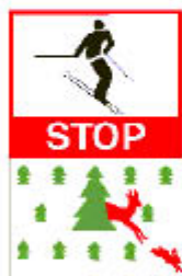
4.1. Зона със защитени растителни или живо- тински видове